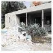
חדר האוכל. פיסת היסטוריה