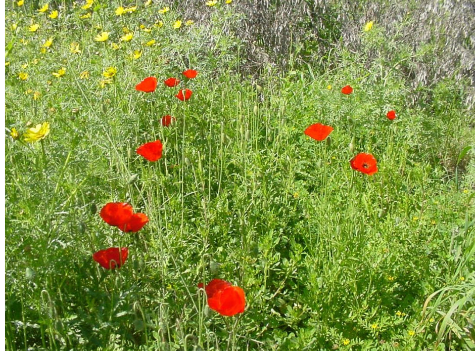
אלמנטים נוספים באתר