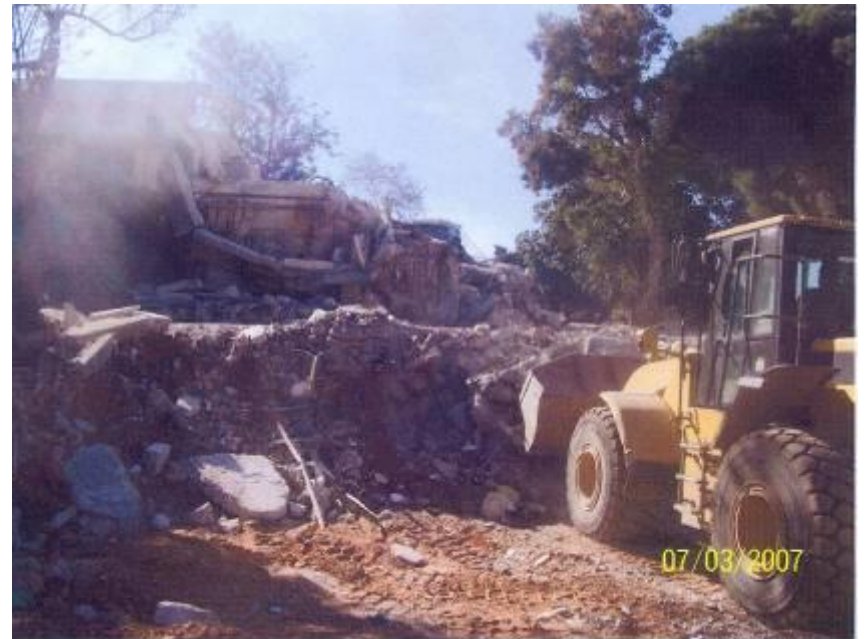
הרס "בדרכי נועם"