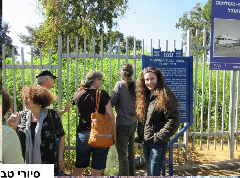
סיורי טבע עירוני